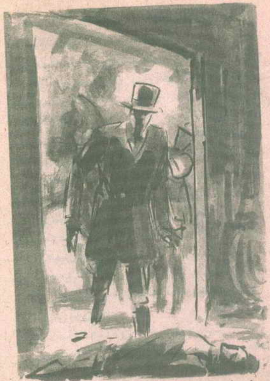
وفى ركن المكان كان هناك رجل راقد يرتدى قميصاً خشناً وسروالاً أزرق ..

تشبهه ( سييل فين ) .. هل تذكر ( سييل ) ؟ حسن ..