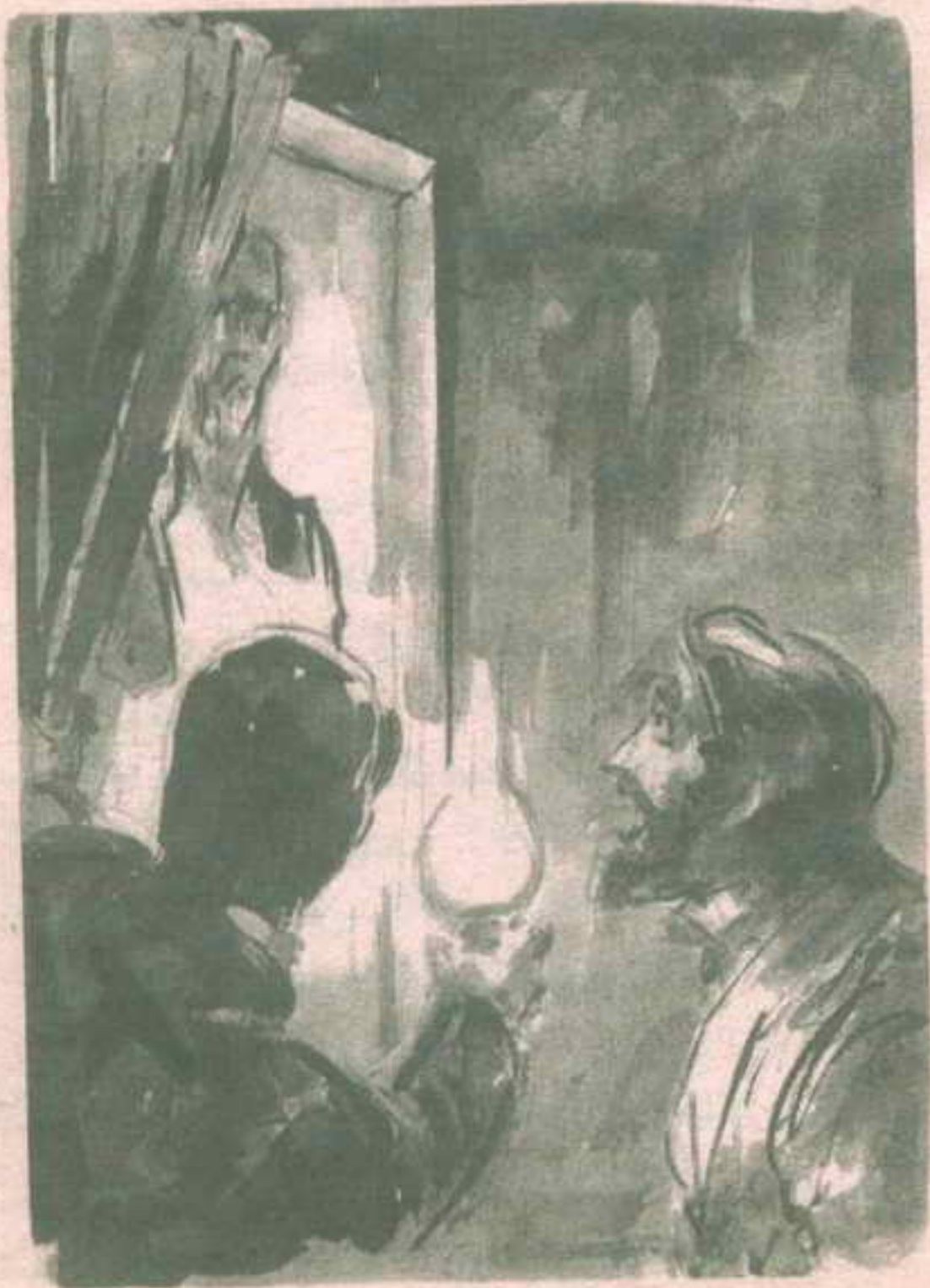
فمدّ ( دوريان ) يده ليزيح الستار ويلقيه جانبًا ..