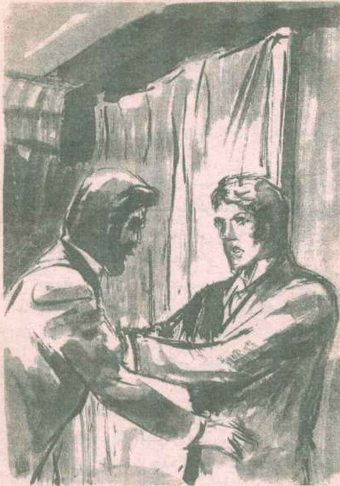
واتجه فى عصبية تجاه اللوحة .. لكن ( دوريان ) وثب ليقف بين الرسام والستار ..

- « لا أنظر إلى لوحتى ؟ لا يمكن أن تكون جاداً .. »