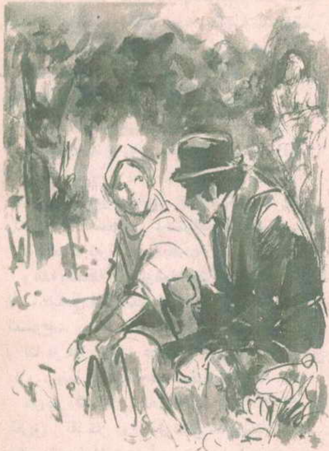
وبكياسة راح يحذرهما من هذا الشاب المتألق الذي يحوم حولها ..

- « إن رؤيته تعنى أن تهيم حباً به .. وإن معرفته تعنى أن تثق به .. إنك تتركني يا ( جيم ) وأنا في أسعد وأعز أيام عمري .. لقد كانت الحياة قاسية علينا لكنها ستختلف .. أنت ذاهب إلى عالم جديد كالذي وجدته أنا فعلاً .. »